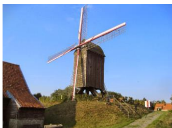
Bezoek aan de molen Hopmuseum te Poperinge

Van 8 tot 12 oktober 2018 gingen onze kinderen van het 6 de leerjaar op Plattelandsklassen naar Vleteren . Een vermoeiende, maar onvergetelijke ervaring!